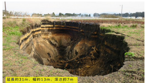
都城・宮崎県の畑で起きた、豪雨によるシラス層の内部侵食による陥没（2016年9月）

地下水の水みちに沿って地盤の一部が侵食され空洞の成長が得意 侵食が進んで空洞・ゆるみが成長 空洞天井部が崩落 それらを繰り返して空洞部が拡大しながら上方に移動